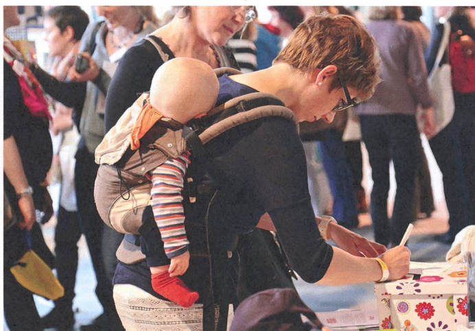
In den Pausen konnten sich die Kongressbesucherinnen austauschen und an den Ständen der Aussteller informieren.

Weitere Bilder unter www.hebamme.ch › Hebammen › Kongress › Kongress 2015: Basel