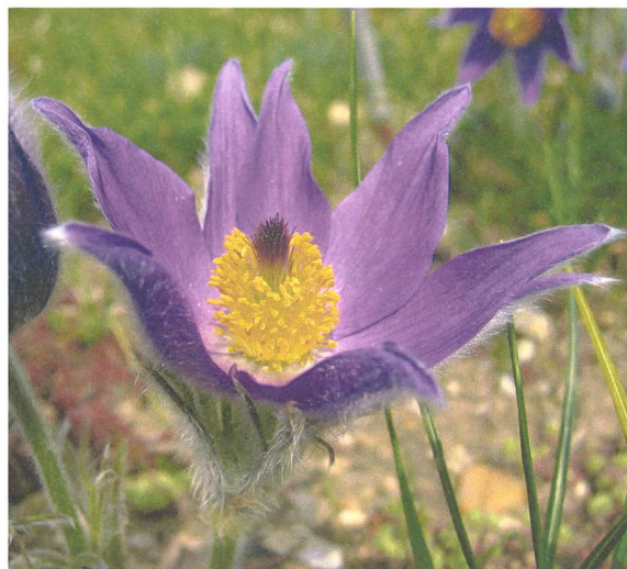
Bei der Küchenschelle spielt die Potenz in der homöopathischen Anwendung eine wichtige Rolle.

Aromatherapie: Die Aromatherapie kennt zwar das ätherische Öl Johanniskraut, es wird jedoch relativ selten verwendet. Es riecht leicht krautig und enthält hauptsächlich Monoterpene und aliphatische Kohlenwasserstoffe (Steflitsch et al., 2013).