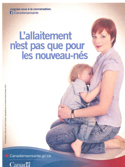
Affiche de «Canadiens en Santé», Gouvernement du Canada (2014).