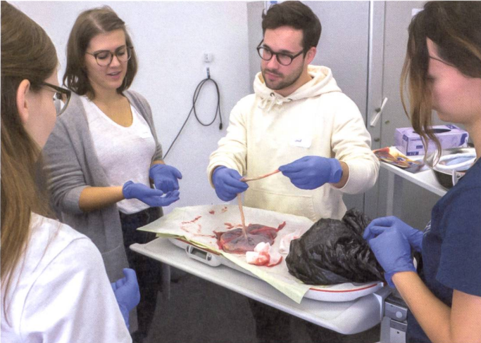
Zürcher Hochschule für Angewandte Wissenschaften

dann noch weit mehr Personen von den beiden Standorten BFH und ZHAW beteiligt. Die umfangreichen vertraglichen Regelungen für alle drei teilnehmenden Institutionen liegen seit 2019 unterzeichnet vor.