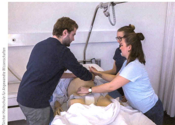
Zürcher Hochschule für Angewandte Wissenschaften