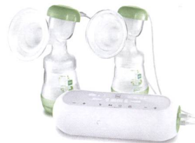
2in1 Doppelmilchpumpe 2en1 tire-lait double