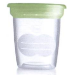
Aufbewahrungsbecher Pots de conservation