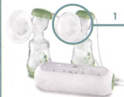
Elektrische Doppelmilchpumpe / Tire-lait électrique double

In 2 einfachen Schritten zur Handmilchpumpe wechseln / Passage en seulement 2 étapes au mode manuel