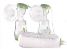
2in1 Doppelmilchpumpe / Tire-lait 2en1 double