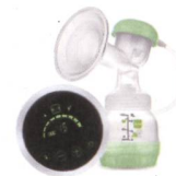
2in1 Einzelmilchpumpe / Tire-lait 2en1 individuel