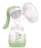
Handmilchpumpe / Tire-lait manuel

In 2 einfachen Schritten zur Handmilchpumpe wechseln / Passage en seulement 2 étapes au mode manuel