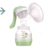
Handmilchpumpe / Tire-lait manuel

MAM 2in1 Doppelmilchpumpe : Effizienz und Komfort perfekt kombiniert. MAM Tire-lait double 2en1 : L'association parfaite de l'efficacité et du confort.