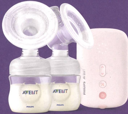
Doppelmilchpumpe Basic SCF397/11