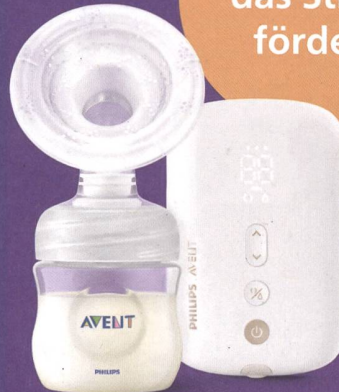
Einzelmilchpumpe Premium SCF396/11