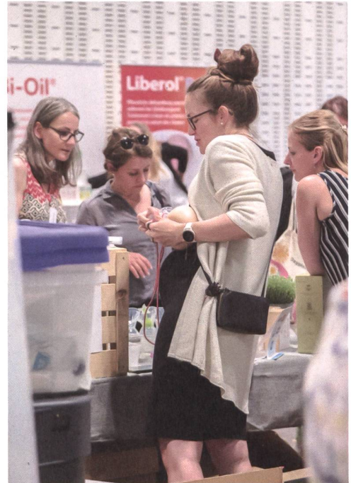
Auch zwischen den Präsentationen und Workshops gibt der Kongress im Ausstellungsraum Möglichkeiten zum Austausch.