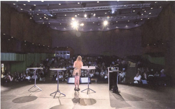
Aus unterschiedlicher Optik beleuchtet: Referate und Workshops drehen sich alle um das Thema Diversität.