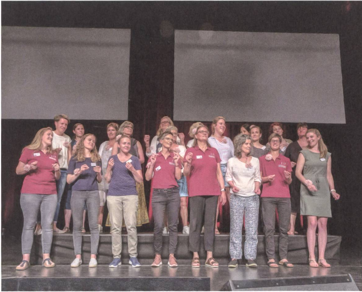
Führt ihren Song vor und animiert zum Mitsingen: die Gastsektion Ostschweiz