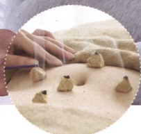
Akupunktur und Moxibustion in der Schwangerschaft