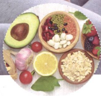
Nahrung fürs Blut - Eisen, Vitamin B12, Folsäure und Co.