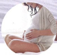
Akupunktur Ausbildung für Schwangerschaft, Geburt, Wochenbett und Stillzeit