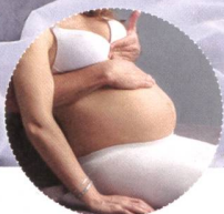
Osteopathische Behandlung der Diaphragmen für Hebammen