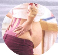
Schwangerschaft bis Wochenbett: Taping für Hebammen

SVH-anerkannte Fort- und Weiterbildungen bei AcuMax Med AG