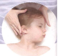
Faszien Distorsions Modell (Säuglinge/Kinder) Kurs