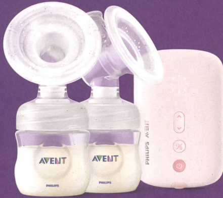
Doppelmilchpumpe Basic SCF397/11