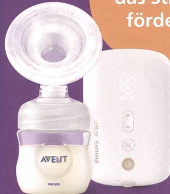
Einzelmilchpumpe Premium SCF396/11