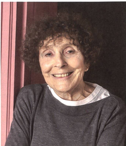
Dre Monique Bydlowski, psychiatre, psychanalyste. Auteure de Devenir mère , Paris, 2020, éditions Odile Jacob.

«L'objectif central des soins à apporter aux désordres du post-partum est à la fois la prise en charge de la détresse morale des jeunes mères et le sauvetage de leur lien premier avec le bébé.»