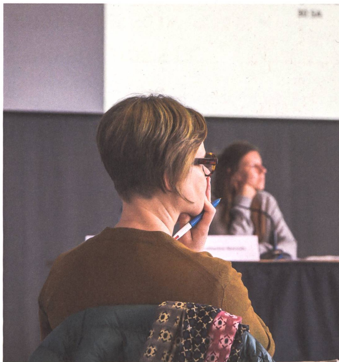
Le Groupe Pivot en atelier: réflexion et échanges interprofessionnels sur la pratique (voir aussi p. 52)