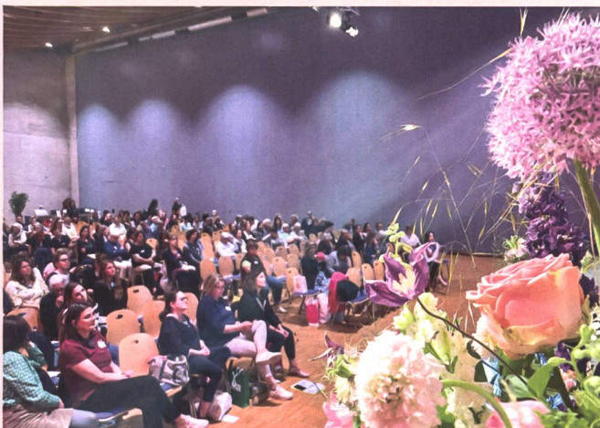
Dans la salle du congrès - en attendant la reprise des interventions