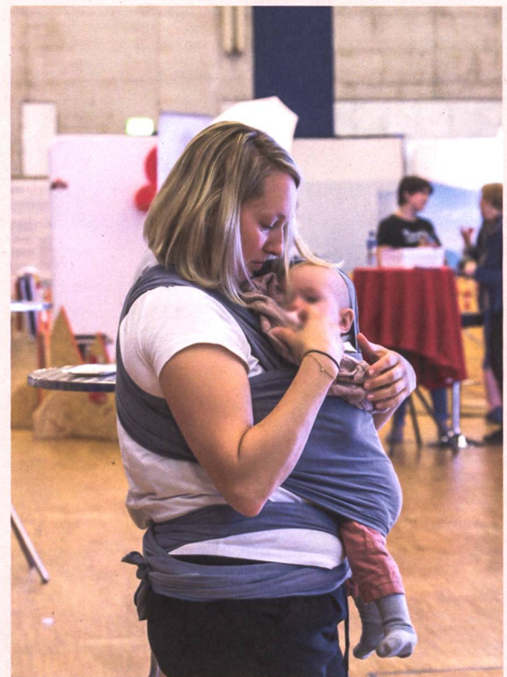
Le Congrès suisse des sages-femmes, un événement tous publics