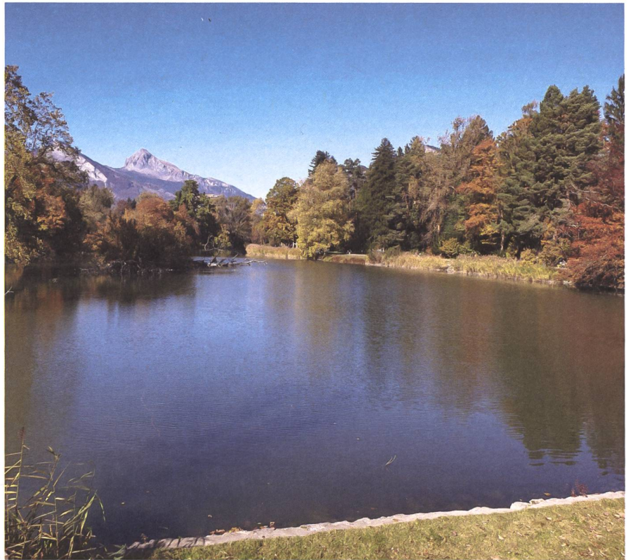
Die Kraft des Gehens nutzen und das Farbenspiel betrachten: Die Gegend um Landquart im Herbst, wo die Spaziergänge stattfinden.

Je nach Konstellation der Frauen dreht sich das Gespräch sofort um die Kinder. Bei anderen dauert es einen Moment, bis sich die