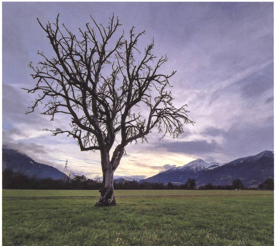
Winterbaum und Schneeberge im Hintergrund: Nicht nur die Natur ist immer wieder anders, auch die Gespräche sind stets einzigartig.