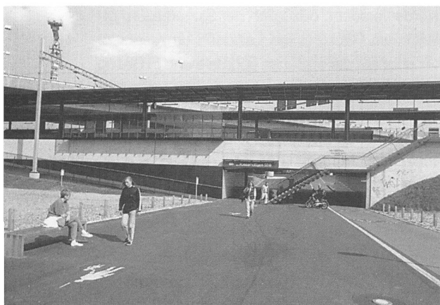
Links by day, rechts by night

Ein vernachlässigter Stadtraum zeichnet sich plötzlich durch eine an diesem Ort unerwartete Grosszügigkeit aus. Die Unterführung ist unge-