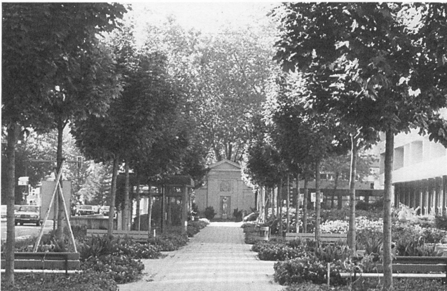
Die Schwarztoranlage nach der Umgestaltung von 1985

Die Casinoterrasse, 1936 erstellt, war der erste Dachgarten mit Baumpflanzungen in Bern, für den sich die damaligen technischen Auflagen der Stadtgärtnerei für den grünen Baumkubus bis heute bewährt haben. 1956 und 1969 wurden an Stelle des Rasens die Plattenbelagsflächen vergrößert und damit auch das „platzartige“ dieser Anlage geschaffen. Notwendig wurden diese Massnahmen, weil der Schattenwurf der Bäume den Rasenwuchs verunmöglichte.