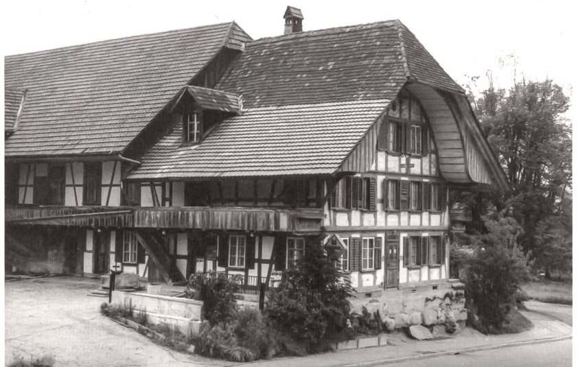
▲ 8 Das «Kreuz» an der Muhlernstrasse 244 in Schliern bei Köniz war bis zu seinem Abbruch im Sommer 1981 ein ortsbildprägendes, von lokalen Vereinen rege genutztes Wirtshaus. Im frühen 19. Jahrhundert erbaut und zuletzt von Einheimischen liebevoll «Morsche Gondel» genannt, geriet es ab den 1960er Jahren – wie das gesamte Schliern – unter grossen Baudruck und wurde abgerissen, obwohl das Haus als erhaltenswert galt. An seiner Stelle entstand ein siebengeschossiges Mehrfamilienhaus. Juni 1981.