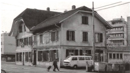
▲ 6 Unweit des ehemaligen «Löwen» wird demnächst auch das «Schützenhaus» an der Bottigenstrasse 10 dichtmachen. Die «Schüdere», in deren Umfeld früher Kutschen und Pferde, zuletzt aber eher Motorräder standen, war 1868 beim Bachmätteli errichtet worden und soll nun einem Neubau für Wohnungen und Gewerbe weichen. Jan. 1990.