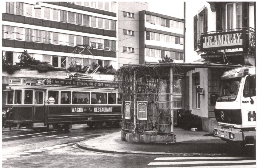
▲ 7 Das Café «Tramway» an der Militärstrasse 64 nahe des Breitenrainplatzes wurde 1899 erbaut und bestand somit bereits zwei Jahre vor der Eröffnung der Strassenbahn ins Nordquartier. Das Tram ist nicht nur in seinem Namen, sondern mit Bildern, Streckenplänen, an alte Sitzbänke erinnerndem Mobiliar und einer Tramskulptur auch im Innern des Lokals präsent. Obwohl nicht historisch, sei es hier vorgestellt, da es an seinem Standort immer mal wieder zu Begegnungen mit dem nostalgischen «Wagon-Restaurant» von BERNMOBIL historique kommt. März 1994.