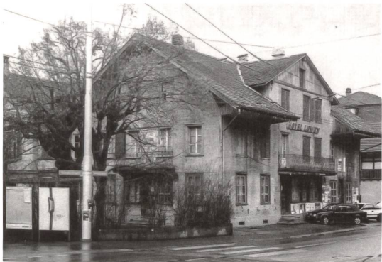
▲ 5 Wo heute die Polizeiwache Bern West steht, thronte an der Bernstrasse 104 bis Anfang 2000 der altherwürdige Gasthof «Löwen», der während langer Zeit auch Hotelzimmer anbot und über eine lauschige Gartenwirtschaft verfügte. Erbaut im 19. Jahrhundert, gehörte er gemeinsam mit dem nahen «Sternen» zu den prägenden Bauten des alten Bümplizer Dorfzentrums. Dez. 1999.