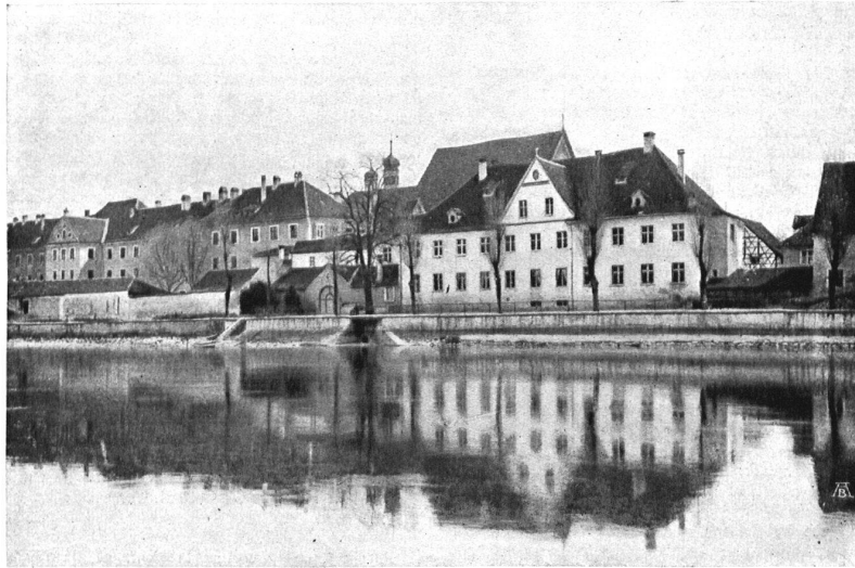
≡ DAS EHEMALIGE KLOSTER ST. KATHARINENTAL AM RHEIN (KT. THURGAU). ≡ ≡ L'ANCIEN COUVENT ST-KATHARINENTAL SUR LE RHIN (THURGOVIE). ≡

Wir hoffen, dass die hohe Regierung des Kantons Thurgau unsern lebhaften Protest gegen eine derartige Verschönerung vernehme und, sofern eine Erneuerung des Fassadenputzes durchaus notwendig ist, anordne, dass die Wiederherstellung im alten, auch in der Farbe zu Gelände und Umgebung einzig passenden Besenswurf ausgeführt werde mit all den Aussparungen an den Fensterumrahmungen, an den Gurten und sonstigen Architekturteilen in Weiss, wie sie der jetzige Zustand zeigt. Wird dann etwa noch die äusserste Ummauerung etwas heller gehalten und zum düstern Hauptgebäude in Gegensatz gebracht, so ist das reizvolle Stimmungsbild gerettet, und wir sind dem Staate Thurgau zu Dank verpflichtet, dass er praktischen Heimatschutz geleistet. (Ein Schaffhauser .)