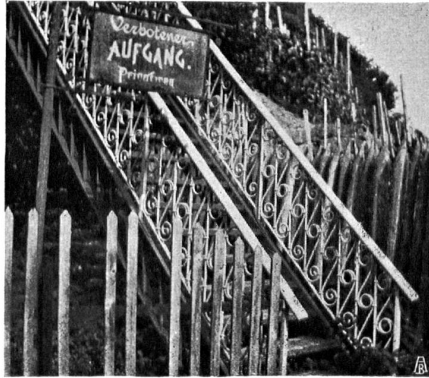
MAUVAIS EXEMPLE L'ACCÈS ACTUEL AU MANOIR DE RHEINECK. Banal escalier de fer, peint en gris