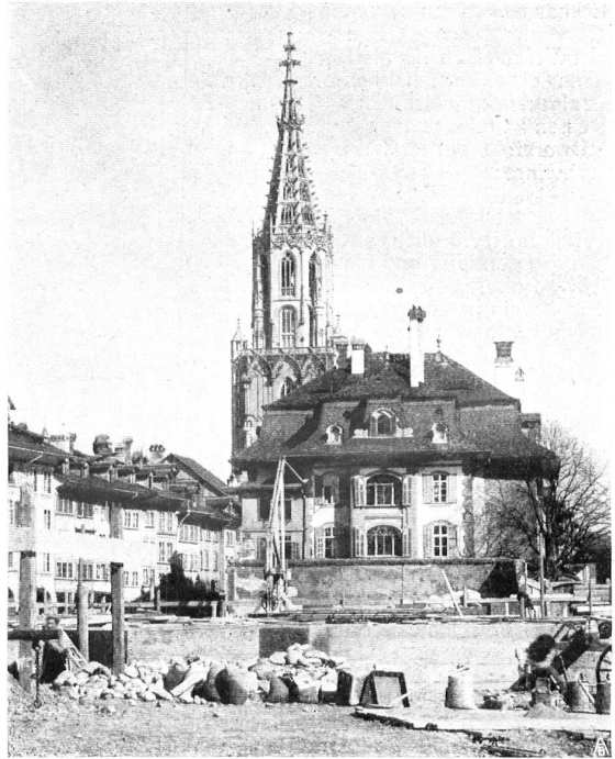
GUTES ALTES PRIVATHAUS AN DER HERRENGASSE IN BERN BELLE VIEILLE MAISON A LA RUE DES GENTILSHOMMES A BERNE

Namens des Vorstandes der Schweizer Vereinigung für Heimatschutz, Der Obmann: A. Burckhardt-Finsler. Der Schreiber: Paul Ganz.