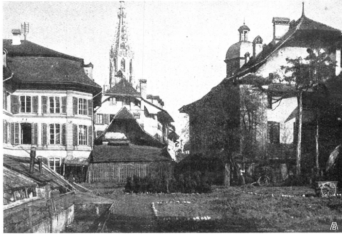
Blick aus dem alten Universitätsgarten nach der Bibliothek und dem Münster zu Bern La Bibliothèque et la Cathédrale à Berne, vues de l'Ancien jardin de l'Université

Schweizerische Vereinigung für Heimatschutz. Vorstandssitzung vom 21. April auf der Kunstsammlung zu Basel: Der Text der Eingabe an die Kantonsregierungen betreffend Erlass von Gesetzen gegen das Plakat-Unwesen wird definitiv festgestellt und über das weitere Vorgehen Beschluss gefasst. — Die Herausgabe einer kleinen illustrierten Propagandaschrift wird genehmigt. — Der Schweizerischen Naturforschenden Gesellschaft werden an die Kosten zur Erhaltung der „Pierre des Marmettes“ 100 Fr., sowie der Abdruck ihres Aufrufs in der Zeitschrift bewilligt. — Die Satzungen der Sektion St. Gallen-Appenzell werden in globo genehmigt. — Mit dem Heimatbund Mecklenburg tritt man in Schriftenverkehr. — Traktanden: Tellsplattebahn. — Artikel der Zürcher Post. — Schöllenenbahn. — Uferschutz am Bodensee. — Kornhaus in Rorschach. — Beitragsgesuch des Naturschutzes für les Marmettes. — Auflage der Zeitschrift. — Generalversammlung. — Propaganda. — Reklamegesetz.