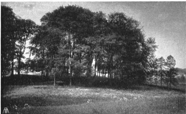
DAS BUCHENWÄLDCHEN BEI ST. FIDEN. Einziger reiner Laubholzbestand der Gegend, ein zukünftiger öffentlicher Park des Ostquartiers. Hoffentlich setzt die Bewegung zur Sicherung desselben bald ein

Vor zwei Jahren wurde über dieses interessante Naturdenkmal das Todesurteil durch Verkauf an einen Steinhauer gesprochen. Nach langen Verhandlungen ist nun ein Vertrag zustande gekommen, laut welchem die Gemeinde Monthey den Block und das ihn umschliessende Grundstück für rund 30000 Fr. erwirbt, wonach er als unveräusserliches Eigentum in den Besitz der Schweizerischen Naturforschenden Gesellschaft übergehen soll. Dieser Betrag mag für einen erratischen