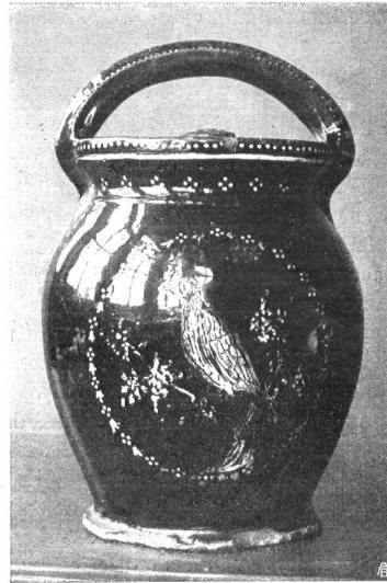
Die Kanne befindet sich im Schweiz. Landesmuseum in Zürich Au Musée national de Zurich

La forme répond bien au but et est en même temps ornementale, très réussie dans son ensemble. La décoration parfaitement appropriée aux surfaces