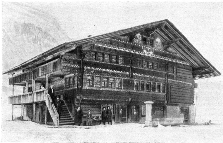
DAS „RUEDIHAUS“ IN KANDERSTEG, das teilweise durch Brand zerstört wurde (12. Januar 1908). LE «RUEDIHAUS» A KANDERSTEG, en partie détruit par un incendie

Reklame-Gesetzgebung im Kanton Luzern. Der Regierungsrat wird dem Grossen Rate einen Gesetzesentwurf zugehen lassen, durch den die Auswüchse im Reklamewesen eingedämmt werden sollen. Gesetzgeberische Arbeit gerade auf diesem Gebiete ist zur unabwendbaren Notwendigkeit geworden mit Rücksicht auf die hässliche Verunstaltung von Strassen, öffentlichen Plätzen usw. durch eine immer anstössiger sich gebärdende Reklame. Die Bestimmungen sind so gefasst, dass dem Unwesen mit Erfolg gesteuert werden kann; besonders zu begrüssen ist die Tatsache, dass das Gesetz rückwirkende Kraft erhalten soll, Erfolge gesteuert werden kann; besonders zu begrüssen ist die Tatsache, dass das Gesetz rückwirkende Kraft erhalten soll,