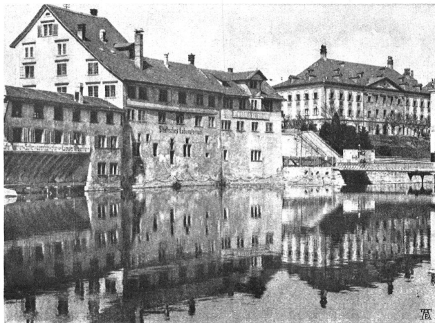
ALTE HÄUSER AM LINKEN UFER DER LIMMAT ZU ZÜRICH, die bald umfangreichen aber nötigen städtischen Neubauten werden weichen müssen

„Urwald“ im Emmental. Riesentannen stehen auf dem Gute Dürsrütti ob Langnau im Emmental. In der Höhe von etwa 900 Meter findet sich das grösste Exemplar von rund 40 Kubikmeter; würde es aufgezolt, so gäbe es wohl 20 Klafter Brennholz. Auf Brusthöhe hat die Tanne einen Umfang von 4,70 Meter. Bis auf die Höhe von 4 Meter ist dieselbe beinahe gleichstämmig. Das Alter wird auf 300 Jahre geschätzt. Das zweitgrösste Exemplar misst 35 Kubikmeter. Exemplare von 25 und 30 Kubikmetern finden sich mehrere. All dies grosse Holz ist trotz seines Alters vollkommen gesund.