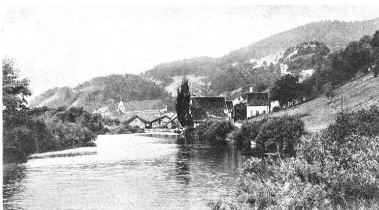
VUE DU DOUBS près de St-Ursanne, d'un aspect calme et reposant DER DOUBS BEI ST. URSANNE, im Hintergrund das Städtchen

En quittant St-Ursanne, il y aurait encore beaucoup de beautés à voir sur le plateau des Franches Montagnes, par exemple le petit village de Peuchapatte avec ses vestiges d'architectures bourgognes; et, en gravissant les gorges du Pichoux, la célèbre abbaye de Bellelay. C'est à Delémont, la seconde capitale des princes-évêques, qui a aussi son château (plus moderne, il est vrai, que celui de Porrentruy), ses vieilles fontaines, sa porte au Loup, ses vieilles maisons, qu'on quitte le Jura nord, soit pour le Laufonnais, soit pour entrer, par les gorges de Moutier, dans le Jura sud. St-Ursanne, le 8 décembre 1908.