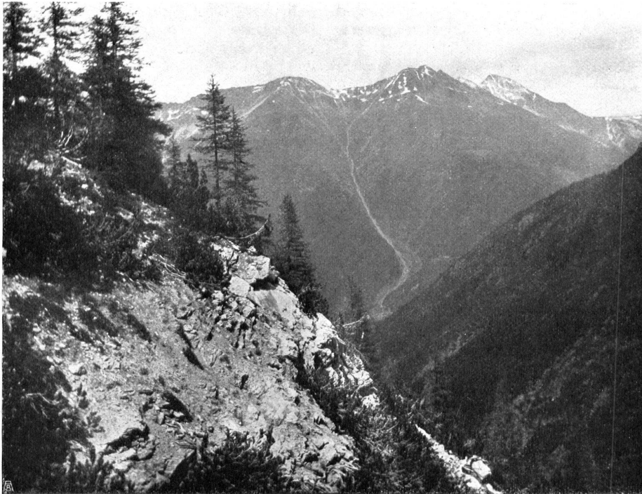
AUF DEM GEISSPFAD DER LINKEN TALSEITE DES VAL CLUOZA mit Legföhren und Lärchen. Blick talanswärts, auf Val Laschadura, Piz Nuna und Piz d'Ivraira auf der gegenüberliegenden Seite des Ofenpasses. SUR LE SENTIER DESCENDANT LE LONG DE LA PENTE GAUCHE DU VAL CLUOZA. Au fond: le vallon de Laschadura, le Piz Nuna et le Piz d'Ivraira de l'autre côté du col de l'Ofen.