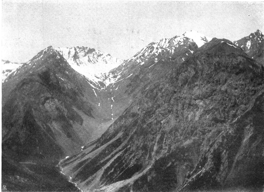
DER HINTERGRUND DES VAL CLUOZA. Links der Monte Serra (3095 m) und Val Sassa mit dem schuttbedeckten kleinen Gletscher und der Fuorcla di Val Sassa, die nach Müschauns hinüberführt, rechts der Piz Quatervals LE PANORAMA DU VAL CLUOZA. A gauche le Monte Serra (3095 m), le Val Sassa avec son petit glacier et le Fuorcla, a droite le Piz Quatervals.