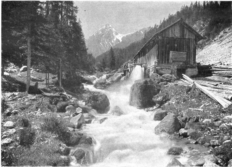
SÄGE IM VAL PLAVNA. UNE SCIERIE DANS LE VAL PLAVNA