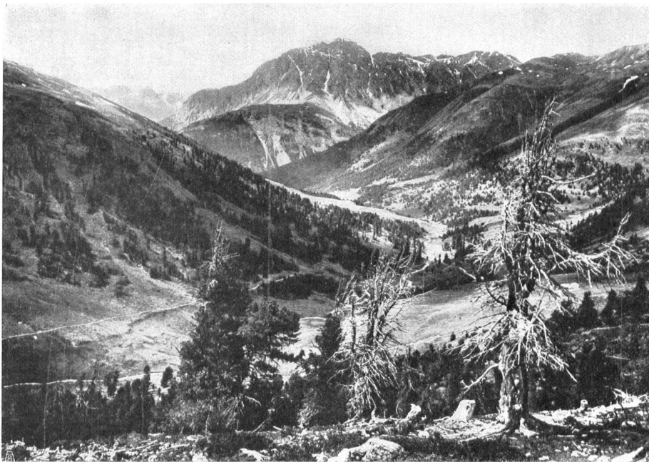
DER OBERSTE SAUM DES WALDES TAMANGUR UND AUSBLICK DAS SCARLTAL ABWÄRTS mit Piz Madlein und Mot Madlein im Hintergrund. — Aufnahme von Ernst Muret , Forst-Inspektor. (Aus Coaz und Schröter, Scarl-Tal) LES ARBRES SUPÉRIEURS DE LA FORÊT DE TAMANGUR, DOMINANT LA VALLÉE DU SCARL. Au fond le Piz Madlein et Mot Madlein. — Photographie de M. E. Muret , Inspecteur des forêts.

Aufnahme von Chr. Meisser , Zürich. Photographie de M. Chr. Meisser , Zurich.