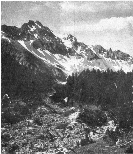
IM VAL MINGÈR: PIZ FORAZ VON DER ALP MINGÈR AUSGESEHEN DANS LE VAL MINGÈR: LE PIZ FORAZ VU DE L'ALPE DI MINGÈR

Die Gemeinde Zernez kam unsern Bestrebungen in sehr anerkennenswerter Weise entgegen; schon von vornherein zeigte sie sich geneigt, auf Verhandlungen betreffend das Val Cluozza einzutreten. Im Oktober 1909 wurde der Vertrag zwischen der Gemeinde Zernez und der schweizerischen Naturschutzkommission unterzeichnet. Laut demselben wird das Val Cluozza vom 1. Januar 1910 der Kommission als