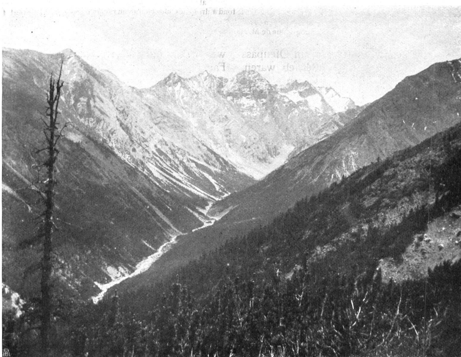
BLICK INS VAL CLUOZA VON „SELVA“ AUS beim Aufstieg zur Wasserscheide, unweit des Talausgangs (Richtung Süd). Im Hintergrund Piz dell'Acqua und Piz del Diavel; an den Hängen links die Alp Murtèr. LE VAL CLUOZA VU DE LA «SELVA», sur la route menant à la ligne du partage des eaux. On voit au loin la vallée s'étendre dans la direction du Sud. Dans le fond le Piz del Diavel et le Piz dell'Acqua, à gauche le versant de l'alpa di Murtèr.