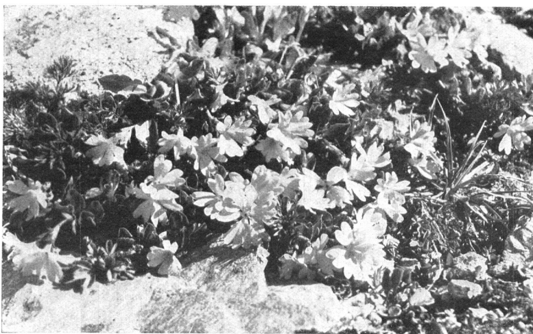
IM VAL CLUOZA. — Gruppe von ganzblättrigen Primeln auf der Alp Murtier LA FLORE DU VAL CLUOZA: Touffe de primevères à feuilles entières, sur l'alpe di Murtier Aufnahme von cand. chem. F. Meyjes ***** Photographie de M. F. Meyjes, cand. chim.