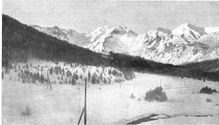
DIE OFENBERGWIESE BEIM HOSPIZ ZUM OFENBERG. Im Hintergrund der beschneite Cluozza-Grat. Im Vordergrund dichte Wälder der geradstämmigen Bergkiefer LES PRÉS DE L'OFENBERG au Hospice. Dans le fond à droite le Cluozza-Grat, au premier plan la forêt

Damit wäre dann die «Pénétration pacifique» des Ofengebietes durch den Naturschutz erreicht und die Bedingungen zur ungestörten Erhaltung einer reichen Pflanzen- und Tierwelt gegeben. «Hier ist das geeignete Land gefunden, wo das grossartige Experiment gelingen muss, aus den erhalten gebliebenen Lebewesen eine nur von der