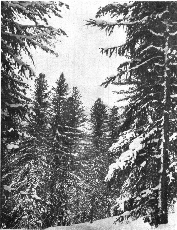
DICHTER ARVENWALD AM MUNT LA SCHERA gegenüber dem Ofenberg. ***** FORÊT D'AROLLES A MUNT LA SCHERA en face de l'Ofenberg.

haben, zu einem guten Ende zu führen. In einer Versammlung, die auf Einladung des Gemeindepräsidenten von Schuls am 27. Februar daselbst abgehalten wurde, konnten sich die anwesenden Mitglieder der Naturschutzkommission überzeugen, dass eine Verwirklichung der geplanten Scarltal-Reservation in allen Teilen der Bevölkerung freudigst begrüsst werden würde.