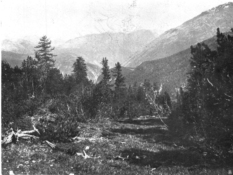
ABSTIEG INS SPÖLTAL. Legföhrenpark mit Lärchen und Arven, im Hintergrund di Cima di Piazzi. VALLEÉ DU SPOL; Forêt de pins, épicéas et mélèzes, au fond la Cima di Piazzi.