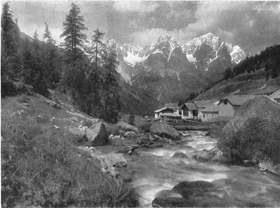
BLICK INS SCARL-TAL, talauswärts; im Vordergrund der Weiler Scarl, im Hintergrund die Unterengadiner Dolomiten. DANS LA VALLÉE DU SCARL. Au premier plan le Scarl. – Dans le fond les Alpes Dolomitiques de la Basse-Engadine.