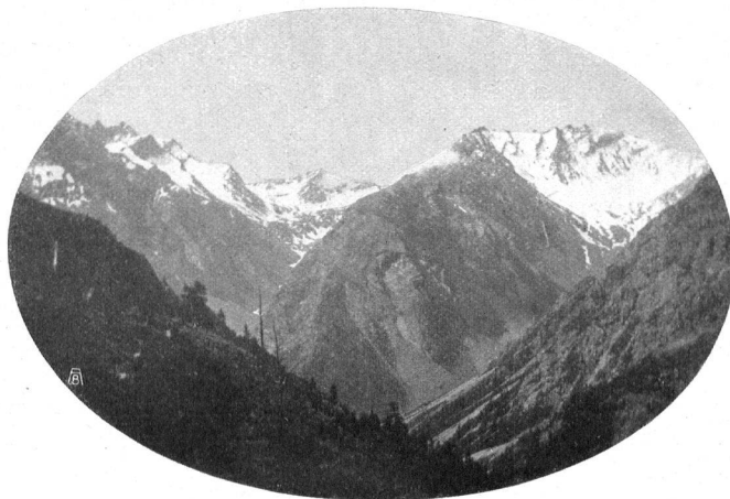
DER HINTERGRUND DES VAL CLUOZA VON ALP MURTÈR AUS GESEHEN Rechts Monte Serra und das Seitental von Valletta; links das Seitental del Diavel, der Piz del Diavel und der Piz dell'Acqua. — Aufnahme von F. Meyjes , cand. chem., Zürich LE PANORAMA DU VAL CLUOZA, VU DE LA MURTÈRALP. A droite le Monte Serra et la vallée de Valletta, à gauche le Val del Diavel, le Piz del Diavel et le Piz dell'Acqua. Photographie de M. F. Meyjes , cand. chim., Zurich

Hier sollen in Wort und Bild dieser Nationalpark und die angrenzenden Gebiete geschildert werden, mit Hinweis auf die nächstliegenden weitem Aufgaben.