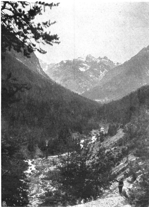
BLICK INS VAL PLAVNA aufwärts vom Fussweg oberhalb der Säge. LE VAL PLAVNA VU DU SENTIER au-dessus de la scierie.