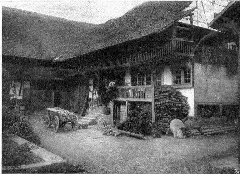
Abb. 24. Schönes altes Bauernhaus in Rüdlingen. Fig. 24. Une belle vieille ferme à Rüdlingen.

angekauft und dadurch die höchste Erhebung des Schweizer Jura vor der Gefahr geschützt, in fremde Hände zu fallen oder mit einem Hotelkasten verunziert zu werden. — Dafür gebührt den weitsichtigen Bürgern allgemeiner Dank!