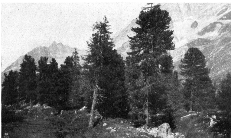
Fig. 14. Quelques beaux spécimens d'arolles.

Möchte der Wunsch des Herausgebers, seinen alten Erbbesitz seines Volkes nicht nur erhalten, sondern auch neu belebt zu haben, in Erfüllung gehen. O. v. Greyerz.