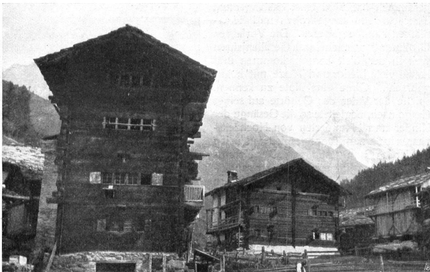
Fig. 2. Vieilles maisons de bois aux Haudères. — Abb. 2. Alte Holzhäuser in Les Haudères.

Montons encore pour admirer le beau panorama qui se déroule devant nous. C'est d'abord l'immense Pigne d'Arolla avec son épaisse couche de neige au sommet