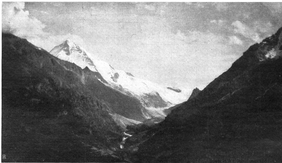
Fig. 3. Le glacier de Ferpècle et l'Alpe de Bricolla. Abb. 3. Blick auf den Gletscher Ferpècle und Alpe de Bricolla.

Mais avant de se reposer dans d'excellents hôtels, — car il n'y a pas seulement des chalets à Arolla, — reportons un peu nos yeux sur ces belles forêts d'arolles (fig. 13 et 14, p. 46 et 47), et admirons la belle nature. —