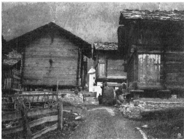
Fig. 1. Une rue aux Haudères. Abb. 1. Strassenbild aus Les Haudères.

LA REPRODUCTION DES ARTICLES ET COMMUNIQUÉS AVEC INDICATION DE LA PROVENANCE EST DÉSIRÉE