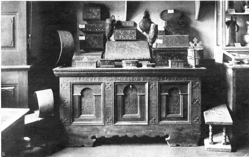
Abb. 4. Gruppe der Kerbschnittkästchen. Die Truhe stammt aus dem Jauntal; rechts davon steht ein vierbeiniger Melkstuhl. Von den Kästchen ist das in der Mitte auf dem Schreibpult stehende, das aus dem Lötschental stammt, durch seine reiche polychrome Malerei besonders beachtenswert. Links neben der Truhe ein Kuhschellenband aus dem Prättigau.

Fig. 4. Groupe de la Sculpture sur bois. La bahut vient du Jauntal; à droite un tabouret à traire à quatre pieds. A remarquer parmi les cassettes celle posée au milieu sur l'écrivoire; cette cassette qui vient du Lötschental est enrichie de splendides ornements polychromes; à gauche à côté du bahut on voit un collier de vache venant du Prättigau.