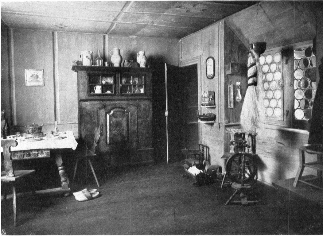
Abb. 2. Fensterwand der „Bauernstube“ in der Ausstellung für Volkskunst und Volkskunde in Basel. Fig. 2. La fenêtre de la „Chambre paysanne“ à l'Exposition de l'Art et de l'Histoire populaires, à Bâle.