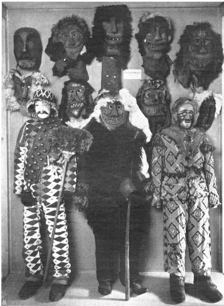
Abb. 1. Eine Anzahl von Fastnachtmasken: in der Mitte und im oberen Teil aus dem Lötschental (Wallis), links « Leg-Ohr » von Aegeri mit aufgenähten Tüchflicken, rechts « Märchler » aus dem Kanton Schwyz.