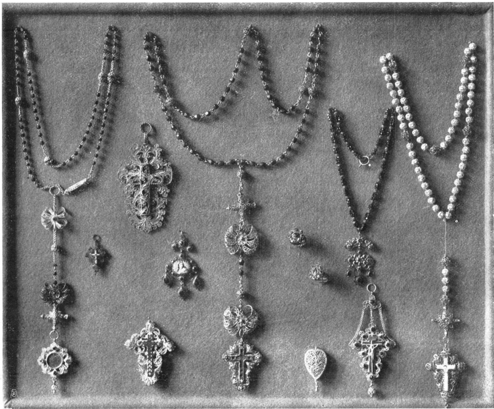
Abb. 8. Obwaldner Rosenkränze, Anhänger und Ringe. Reiche Silberfiligranarbeiten aus der Sammlung von Herrn Dr. Etlin, Sarnen. - Fig. 8. Bijoux de l'Obwald. Chapelets, crucifix, pendentifs et bagues. Merveilleux travaux de filigrane. (Collection de M. le Dr Etlin, à Sarnen.)