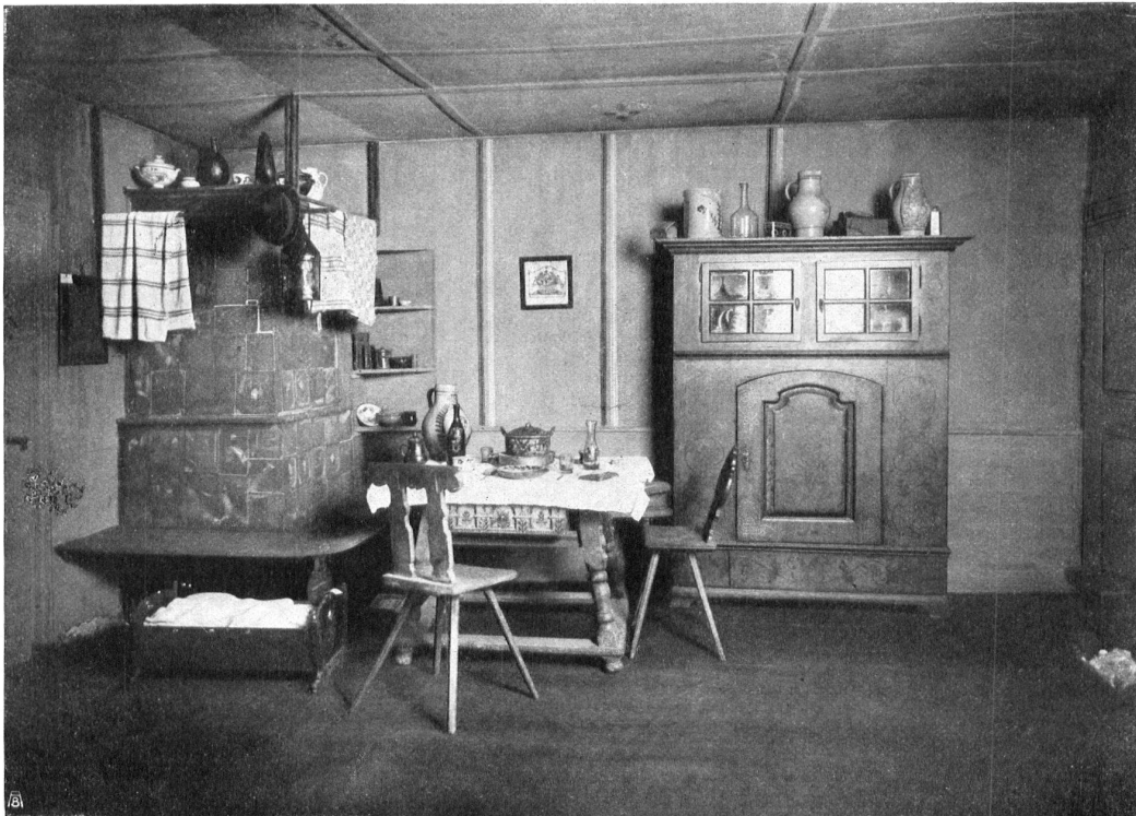
Abb. 3. Ofenecke der „Bauernstube“ in der Ausstellung für Volkskunst und Volkskunde in Basel. Fig. 3. Le coin du poêle de la „Chambre paysanne“ à l'Exposition de l'Art et de l'Histoire populaires, à Bâle.

Die den Abbildungen dieses Heftes zugrunde liegenden Photographien sind von Photograph August Höflinger, Basel, angefertigt worden. Les photographies que nous reproduisons dans ce numéro ont été prises par M. Aug. Höflinger, photographe, à Bâle.