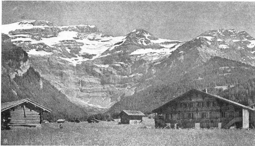
Ferme vaudoise et vue des Diablerets. Waadtländer Bauernhaus mit Blick auf die Diablerets.