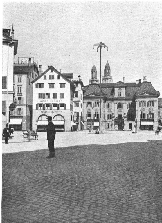
Der Münsterhof mit dem Riesenkandelaber. Le «Münsterhof» avec le nouveau réverbère.