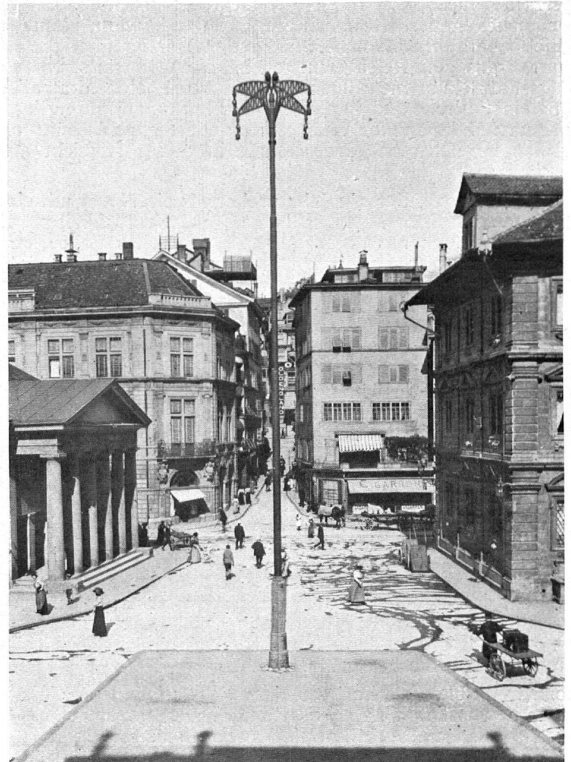
Die Gemüsebrücke mit dem Riesenkandelaber. Le nouveau réverbère sur la Gemüsebrücke.