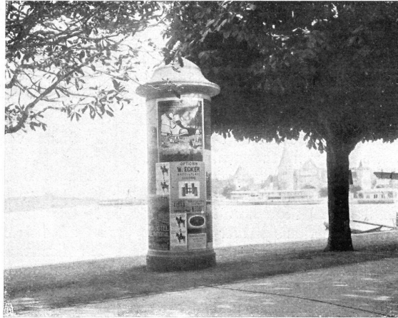
Schlechtes Beispiel. Neue Plakatsäule in Luzern. In aufdringlicher Weise zwischen den Promenadenweg und den See hingepflanzt. — Mauvais exemple. Nouvelle colonne d'affichage à Lucerne. Placée d'une façon très déplaisante entre la promenade et le lac.

der Geschichte des modernen Anzeigewesens geradezu einen Rekord darstellen, den sich spätere Kulturhistoriker nicht entgehen lassen dürften. Wir sehen hier an einem krassen Beispiel, wie weit die Reklame in der Ausnützung der öffentlichen Interessen gehen kann — wenn es ihr niemand wehrt! In Basel z. B., wo für die Aufstellung jeder einzelnen Plakatsäule die Genehmigung des Polizei- und des Baudepartementes notwendig ist, gelangte die Allgemeine Plakatgesellschaft an den Heimatschutz um Begutachtung ihrer neuen Pläne. Sollen wir der gleichen Gesellschaft einen Vorwurf machen, wenn sie die ihr weit günstigere Konjunktur