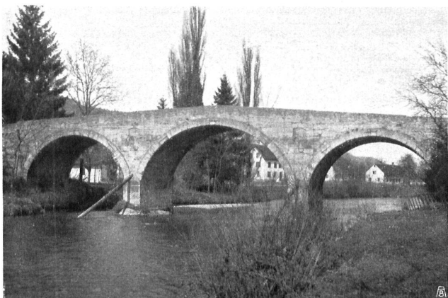
Die Brücke von Rorbas - Freienstein. Durch die Grösse ihrer Proportionen, durch den Schwung der Bogenführung und die Einfachheit des ganzen Aufbaues gemahnt diese Brücke fast an antike Werke verwandter Art. Man hofft die Brücke modernem Verkehr anpassen zu können, ohne sie opfern zu müssen. Le pont de Rorbas-Freienstein. Le pont rappelle la sévère beauté de certaines constructions antiques par la grandeur monumentale de ses proportions, par la courbe élégante de ses arches et par la simplicité de l'ensemble. On espère réussir à conserver ce pont tout en l'adaptant aux exigences de la circulation moderne.

Heimatschutzes gaben Veranlassung, das Brückenprojekt vorderhand zurückzulegen. Wer das hübsche Dorfbild von Rorbas und die Brücke von rassisger, man möchte sagen fast antiker Silhouette, kennt, wird ihre Erhaltung wünschen; gelingt es auf einem den Heimatreiz nicht schädigenden Wege mehr Bequemlichkeit zu schaffen, so wird sich dessen gewiss jedermann freuen.