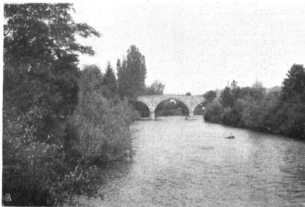
Die Brücke von Rorbas - Freienstein. Ein Beispiel, wie die Wirkung eines Landschaftsbildes durch ein ihr angepasstes Werk der Technik noch gesteigert werden kann. Eine Eisenbrücke an Stelle der massiven Steinbogen müsste gerade den gegen-telligen Eindruck vermitteln. - Le pont de Rorbas-Freienstein. Exemple de paysage dont la beauté peut encore être relevée par une construction d'ordre purement pratique quand celle-ci est en harmonie avec la nature qui l'entoure. Un pont en fer remplaçant ces massives arches de pierres produirait certainement un effet tout contraire.

Plakatsäulen-Wettbewerb. Wir verweisen auch an dieser Stelle auf die heutige Beilage , die von der Sektion Basel unsern Mitgliedern in dankenswerter Weise überreicht wird.