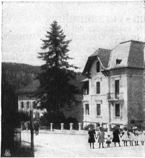
Abb. 21. Bemerkenswert schöne Lärche, welche die Häuserreihe einer jurassischen Dorfstrasse angenehm und schmückend unterbricht.