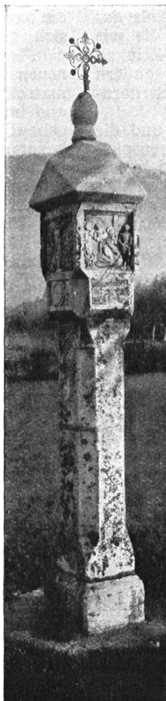
Abb. 20. Marterl bei Sterzing, Tirol. — Fig. 20. Calvaire, aux environs de Brixen, en Tyrol.

Wir unterschreiben dieses Programm Wort für Wort und sind überzeugt, dass die so vornehme, gehaltvolle Publikation Martin Gerlachs für weite Kreise eine heilsame, tiefgreifende Stärkung des künstlerischen Gefühls bedeutet. Dieses Ziel wird um so eher erreicht, als eben die künstlerische Anschauung im Vordergrund steht, kein Interesse der antiquarischen Forschung oder kunstgeschichtlicher Inventarisierung. Her-