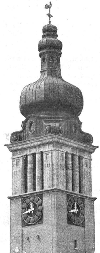
Sumiswalder Turmuhren- Fabrik von J. G. BAER SUMISWALD (Bern).

Projektiert Gartenanlagen und leitet deren Ausführung Aufstellung v. Bepflanzungsplänen Atelier f. Gartenarchitekturen