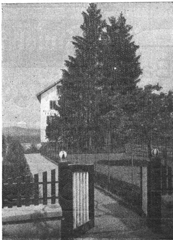
Garten W. in Affoltern a. A. Im Hintergrunde unter den 4 Tannen das Gartenhaus. Otto Froebels Erben, Zürich 7.

Dies soll jetzt in bewusster, sicherer Weise geschehen. Hiezu hat die eidgenössische Kommission für die Erhaltung historischer Bau- und Kunstdenkmäler unlängst ein Projekt ausgearbeitet, das eine allgemeine, dem Stil der Zeit entsprechende Renovation der Ringmauern und des in ihrer Linie liegenden Schlosses von Murten vorsieht. Die Gesamtauslage hiefür wird auf 57,000 Franken berechnet. Hievon entfallen einzig auf die Schlossrenovation 16,000 Franken. Die Kosten sollen gemeinsam von Bund, Kanton und Gemeinde getragen werden; letztere würde jedoch am schwersten davon belastet. Die Renovation soll in einer allgemeinen Ausbesserung und, wo störend modernisiert worden ist, in einer dem Alter entsprechenden Wiederherstellung bestehen. Baufällig im eigentlichen Sinne des Wortes sind die Festungswerke von Murten nicht und man darf der Gemeindebehörde für die bisherige gute Unterhaltung Dank wissen, wenn ihr auch die Erhaltung bis auf die heutige Zeit kaum als Verdienst angerechnet werden