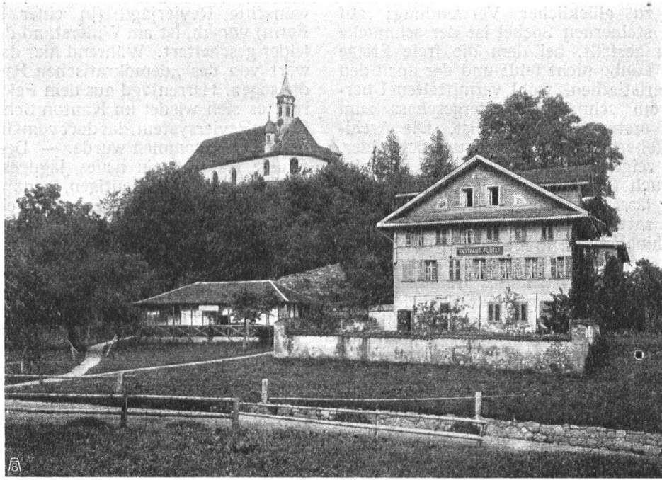
Abb. 9. Die Wallfahrtskapelle im Flüeli und das Gasthaus (früher zugleich Kaplanei) vor den Um- und Neubauten. — Fig. 9. La chapelle, lieu de pèlerinage, à Flüeli et l'hôtel, qui servait autrefois en même temps de cure, avant et après la reconstruction.