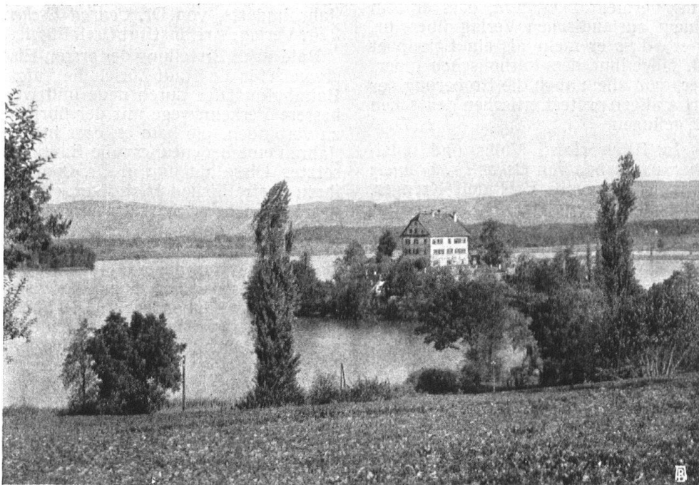
Abb. 8. Schloss Mauensee (Kanton Luzern). Natur und Bauwerk geben ein Bild von harmonischer Stimmung. — Fig. 8. Le château de Mauensee (canton de Lucerne). La nature et le château forment un ensemble très harmonieux.

Die Aufnahmen Nr. 7 und 8 stammen aus dem Photographien-Wettbewerb der Sektion Innerschweiz des Heimatschutz. — Les clichés nos 7 et 8 sont empruntés au concours de photographies de la section de la Suisse centrale du « Heimatschutz ».