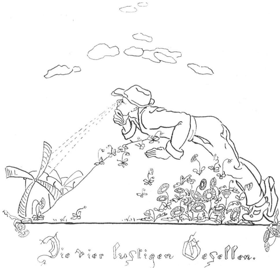
Abb. 7. Wiedergabe aus „Schweizer Märchen“ von Hanns Bächtold , illustriert von Lore Rippmann . Verlag Kober, Spittlers Nachfolger, Basel. Fig. 7. Gravure extraite des «Contes Suisses» par Hanns Bächtold , illustrés par Lore Rippmann . Librairie Kober, Spittler successeur, Bâle.

vagen Umrissen das Gebiet zu bezeichnen, in dem die Gutgesinnten, die die Ackerarbeit bis ins Kleine und Einzelne nicht scheuen, zu «wärchen» hätten — sofern uns der Weltkrieg zu Atem kommen lässt. Das walte Gott! Lebendig persönliche, vaterländisch sich äussernde Künstler haben wir genug. Es ist Abbruch am nationalen Geistesgut, wenn fortwährend ansehnliche und verdienstliche Bucherscheinungen heimatlicher Art gewandten Tageswerkclern, statt den vaterländisch Aufrechten zufallen.