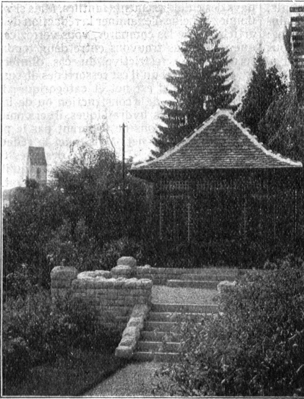
Teehäuschen mit vorgebauter Terrasse.

OTTO FRÖBEL'S ERBEN Gartenarchitekten, ZÜRICH 7