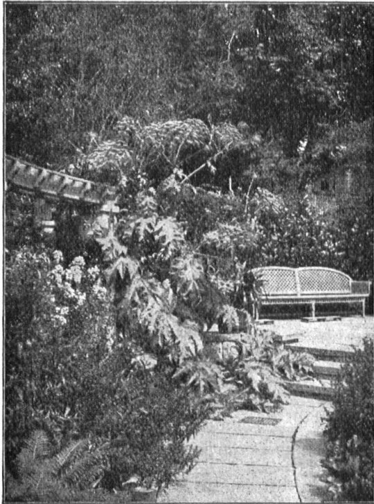
Staudenvegetation im zweiten Jahre nach der Pflanzung

OTTO FRÖBEL'S ERBEN Gartenarchitekten, ZÜRICH 7