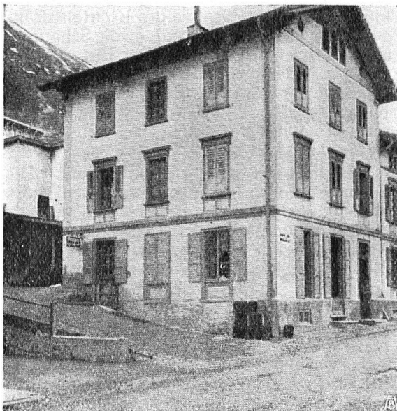
Fig. 16. L'ancienne maison de Pontresina qui a fait place au monumental Hôtel Rosatsch. Pour une fois un vieux bâtiment bien remplacé. — Abb. 16. Haus in Pontresina, das nun im stattlichen Neubau des Hotels Rosatsch aufgegangen ist. Für einmal kein schlechter Tausch.

schon seit Jahren vor dem unsinnigen Wettlauf im Bau von Hotelkasten gewarnt haben, aber kein Gehör fanden! Ganz abgesehen von den schlimmen ökonomischen Folgen dieser