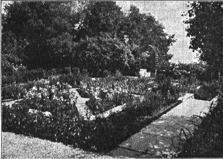
Blumengärtchen mit Ausblick auf den See

OTTO FRÖBEL'S ERBEN Gartenarchitekten Zürich 7