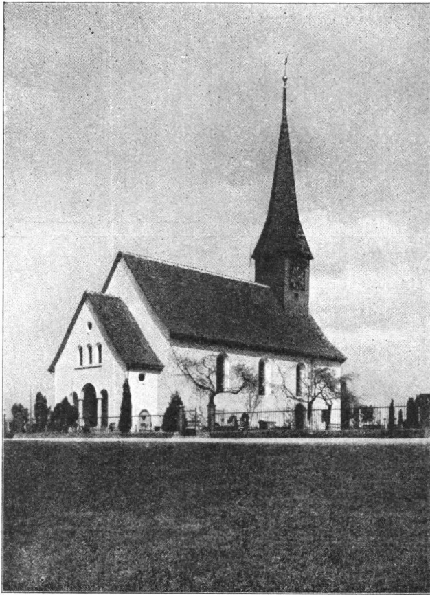
Abb. 7. Kirche in Affoltern bei Zürich. Anlässlich der glücklich durchgeführten Erneuerung wurde im letzten Herbst ein unschöner hölzerner Vorbau durch einen guten steinernen ersetzt. — Fig. 7. Eglise d’Affoltern, près Zurich. A l’occasion de sa rénovation, l’automne dernier, un porche laid en bois a été remplacé par une construction en pierre, simple et de bon goût.

hohle Stamm wird, um ihn vor weiterer Schädigung durch eindringendes Regenwasser zu schützen, ausgefüllt werden.