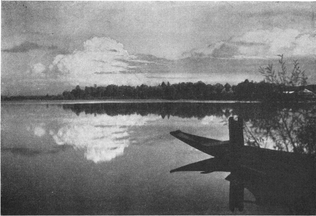
Abb. 3. Rechtes Ufer des grossen Sees. Von links nach rechts: Birkenwäldchen, Badeplatz, Staatswaldung, Eisschuppen. — Fig. 3. Rive droite du lac supérieur. De gauche à droite: bois de bouleaux, bains, forêt de l'Etat, hangar à glace.