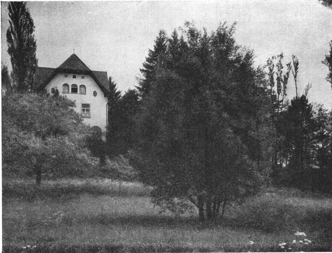
Abb. 4. Das Herrschaftshaus. (Siehe auch Abbildung 2.) Aufnahme von Joh. Meiner. Fig. 4. La villa du Katzensee. (Voir aussi vue n° 2.)