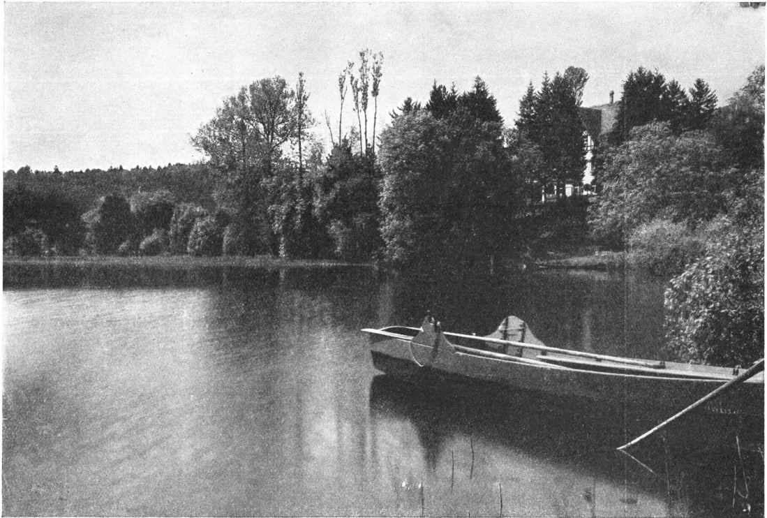
Abb. 5. Bucht beim Herrschaftshaus, Aufnahme von Joh. Meiner. — Fig. 5. Baie près de la villa.