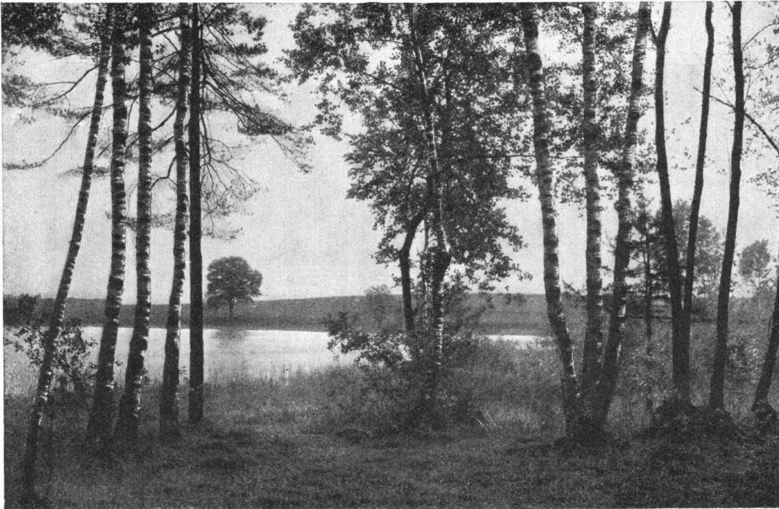
Abb 1. Blick aus dem Birkenwäldchen auf den kleinen Katzensee. Fig. 1. Le petit Katzensee vu à travers un bois de bouleaux.