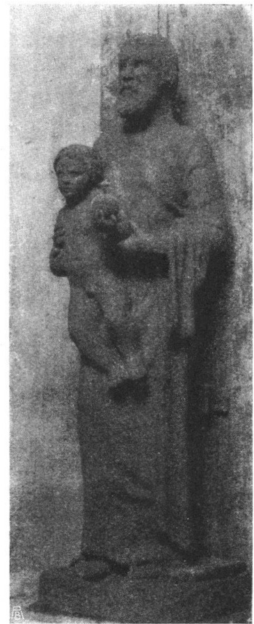
Abb. 18. St. Josef. Steinplastik für die Josefskirche in Zürich. Von Paul Osswald, Zürich. — Fig. 18. Saint Joseph, statue en pierre, pour l'église Saint Joseph, à Zurich, par Paul Osswald, Zurich.

Verkehrsamt und Heimatschutz. Die Debatte über das schweiz. Verkehrsamt, die im September in unserem Ständerat stattfand, zeitigte mehrere Reden und Anträge, die den Freund des Heimatschutzes lebhaft interessieren dürfen. Der grossen Aktion, die der Hebung des Fremdenverkehrs und damit des Hotelwesens dienen soll, wurden Wünsche und Weisungen gewidmet, die hoffentlich weitgehende Berücksichtigung finden. Die Herren Ständeräte G. von Montenach und Oskar Wettstein haben in magistralen Reden auseinandergesetzt, dass von einer bedingungslosen Unterstützung und Förderung der „Fremdenindustrie“, auf deren Nachteile die Anhänger des Heimatschutzes immer wieder warnend hingewiesen haben, heute nicht die Rede sein könne. Die Luxushotels, die unschweizerischen Lakaidienst grosszogen und wertvolle produktive Kräfte des Landes an sich fesseln, jene Palaces, die den Einheimischen das Beispiel übertriebener Lebenshaltung geben, aufdringliche Kastenbauten, die Landschaft und Bautradition missachten, sie sollen sich nicht ins Ungemessene vermehren! — Unsere Volkswirtschaft hätte wohl auch ohne Krieg