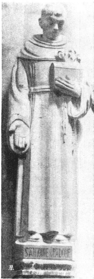
Abb. 17. St. Anton. Steinplastik für die Notre-Dame-Kirche zu Genf. Von Franz Baud, Genf. Fig. 17. Saint Antoine, statue en pierre pour l'église Notre-Dame à Genève, par Franz Baud, Genève.