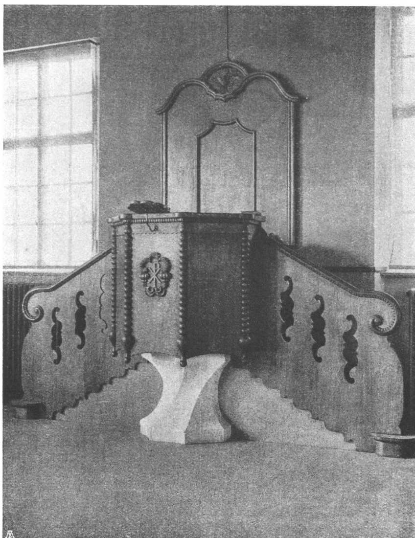
Abb. 20. Kanzel im Saal für Gottesdienste in Oftringen. Gediegene Holzarchitektur nach den Entwürfen von Joss und † Klauser, Arch. B. S. A. in Bern. — Fig. 20. Chaire destinée à une salle de prières à Oftringen. Bonne architecture en bois de MM. Joss † et Klauser, architectes, à Berne.

minait par les thèses ci-après, qui prouvent avec quelle hauteur de vues le Conseil des Etats a traité la question, dont l'importance, beaucoup plus grave qu'une simple affaire économique, a également été relevée par le Conseil fédéral.