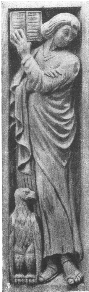
Abb. 21. St. Johannes. Evang. Holzgeschnitzte Kanzelfüllung. Von Carl Fischer, S. W. B., Zürich. — Fig. 21. Saint Jean, l'Évangéliste, sculpture en bois, décoration de chaire, par Carl Fischer, S. W. B., Zurich.

phique, ceci pour les conférenciers qui veulent traiter spécialement certaines contrées de la Suisse. On s'aperçoit malheureusement en parcourant ce chapitre-ci, que notre collection a encore de nombreuses lacunes, surtout pour les cantons d'Aarau, de Fribourg, de Genève, de Glaris, de Neuchâtel, de Soleure, du Tessin, de Vaud et de Zurich. Il serait vivement à souhaiter que les sections qui gardent pour elles-mêmes leurs clichés ou qui n'en possèdent pas encore, suivissent le louable exemple d'autres sections plus généreuses et qui ont envoyé leurs clichés en dépôt à l'Office central du Heimatschutz à Berne, 44, Mittelstrasse. (Pour tous les nouveaux clichés le format 8½ : 10 est désiré.) Ces clichés sont classés à l'Office