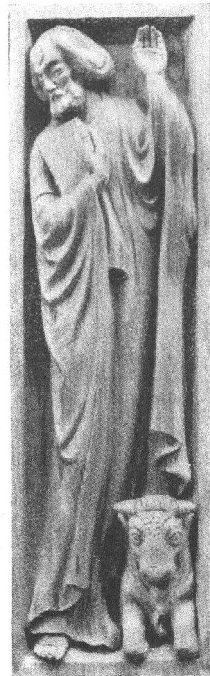
Abb. 22. St. Lukas. Kanzelfüllung. Wie das Pendant Abb. 21 für die protestantische Kirche in Cham. — Fig. 22. Saint Luc, pendant du précédent, sculpture en bois, décoration de la chaire pour l'église protestante de Cham.

Chaque section est priée, vu nos frais considérables d'impression, de se procurer