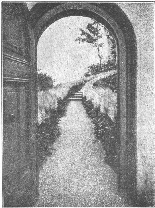
Zugang zum Garten aus dem Hofe