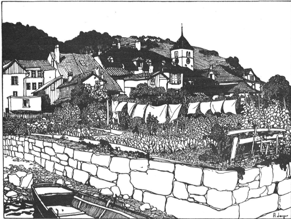
Abb. 1. Twann vom Strand aus. Nach einer Federzeichnung von A. Jaeger-Engel in Twann. Fig. 1 Douanne vue prise des rives du lac. D'après un dessin à la plume de A. Jaeger-Engel, à Douanne.