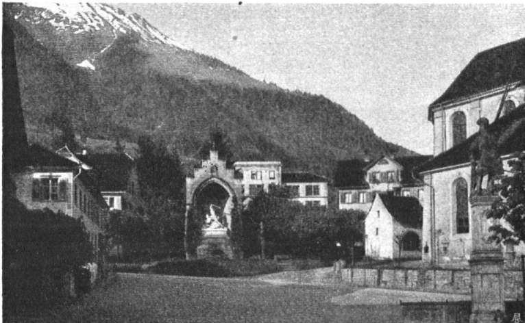
Abb. 19. Früheres Platzbild in Stans: das flach eingedeckte Schulhaus fügte sich dem Gesamtbild nicht gut ein. — Fig. 19. Vue de la place du village, à Stans, telle qu'elle était jadis. Le toit en terrasse de la maison d'école jure avec le style général des autres bâtiments.

In dieser Behörde war er der einzige, der beim Herannahen der eidgenössischen Truppen die Flucht verschmähte. „Ein Soldat flieht nicht,“ soll er barsch auf die unwürdige Zumutung erwidert haben. General von Sonnenberg beschloss auf dem Steinhof sein wechselvolles, reiches Leben am 26. März 1850.