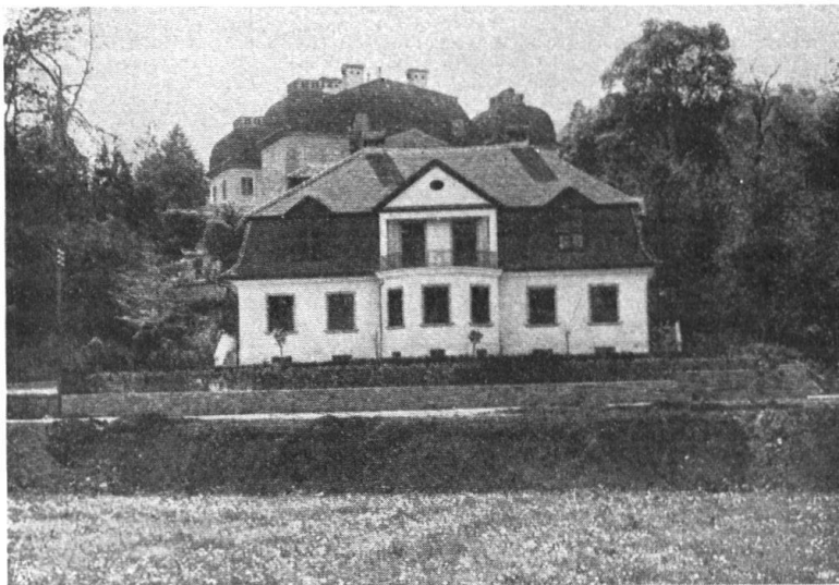
Abb. 17. Heutiger Blick auf die Hauptfassade des Schlosses Steinhof in Luzern. Moderne Villen umstellen heute das Schloss bis auf wenige Meter in der Umgebung. — Fig. 17. Aujourd'hui des villas modernes qui s'avancent jusqu'à quelques mètres du château, en cachent complètement la façade et défigurent le paysage.

Das Schloss Steinhof in Luzern. Von alters her galt der sog. Obergrund, der sich in weitem Umfang südlich der Stadt hinzieht,