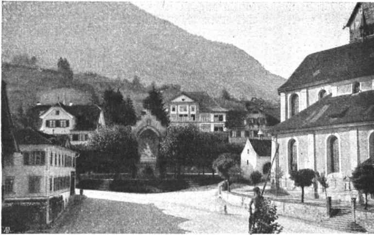
Abb. 18. Der Dorfplatz in Stans. Das Schulhaus, rechts hinter dem Winkelrieddenkmal, hat durch einen glücklichen Dachumbau eine dem örtlichen Baucharakter wohl angepasste Silhouette erhalten. — Fig. 18. La place du village à Stans. La toiture de la maison d'école, qui s'élève derrière le monument de Winkelried, a été transformée. La silhouette est maintenant en harmonie avec l'architecture des constructions voisines.