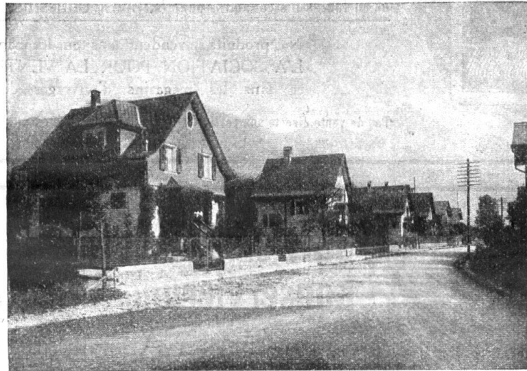
Eternithäuser - Kolonie · (1911-1913 erstellt)