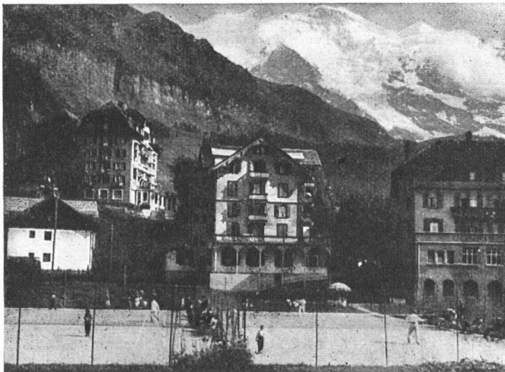
Tennisplätze des Kurverein Wengen

Anlage von Tennisplätzen mit Spezialmergel Dunkelgrüne Absandung