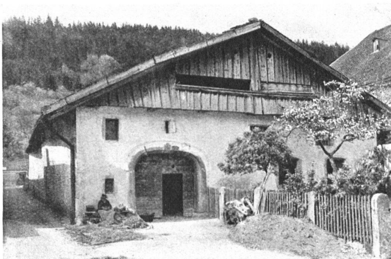
Fig. 20. Ferme à Dombresson. On retrouve ici le type de la «ferme neuchâteloise» au toit largement ouvert et qui maintient la note pittoresque dans une vallée que gagne l'industrie. — Abb. 20. Bauernhaus in Dombresson. Typus des Neuenburger Bauernhauses, ausladendes Dach mit breiten Oeffnungen. Ein malerischer Moment in Gegenden, die schon der Industrie ausgeliefert sind.

sont remarquables par l'ensemble plus que par le détail. A Boudry, minuscule Fribourg, le pittoresque jaillit de la conformation du terrain qui, à son tour a ordonné le groupement des maisons et commandé leur architecture; comme un couvercle à sa boîte, le paysage et l'architecture sont à l'exacte mesure l'un de l'autre, d'où double poésie. On n'a pas toujours su adapter les constructions nouvelles au caractère du lieu; plus d'une tache les dépare — au Landeron une laide chapelle protestante, à Boudry un collège banal. — Mais que de découvertes charmantes dans les villages du Vignoble, que de coins désuets et imprégnés d'un passé émouvant, comme les vieilles manufactures